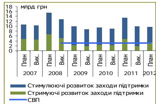
Рисунок 1 Державні витрати на програми підтримки сільського господарства та розвитку сільських територій (млрд. грн)

Витрати на проведення земельної реформи зросли у 5 разів, що, можливо, відображає підготовку влади до введення повноцінного ринку землі з січня 2013 року. Частка витрат на наукові дослідження та розробки склала 13%, що на 8% більше, ніж у 2011 році. Не зважаючи на 8% зменшення витрат на ведення лісового господарства, їхня частка залишається значною та зросла ще на 2% у 2012 році. Витрати на контроль безпеки та якості продукції, а також санітарні та фітосанітарні заходи залишилися на рівні відповідно 3% та 2%. Інші стимулюючі заходи склали до 1% та менше.