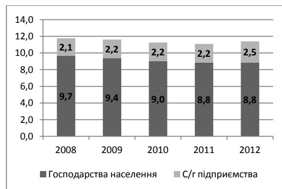
Рисунок 1. Виробництво молока в Україні, за категоріями виробників, млн. т