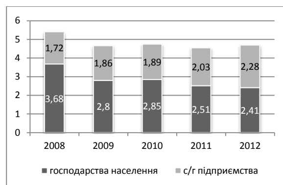
Рисунок 4. Постачання молока на переробку, за категоріями постачальників, млн. т