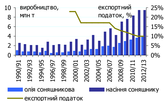
Рисунок 2. Розвиток олійної галузі