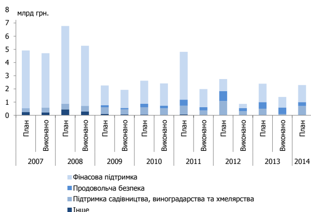
Рисунок 2. Виробничі субсидії та заходи