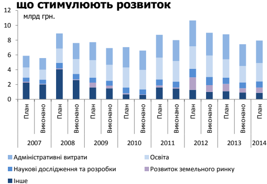
Рисунок 3. Заходи державної підтримки, що стимулюють розвиток